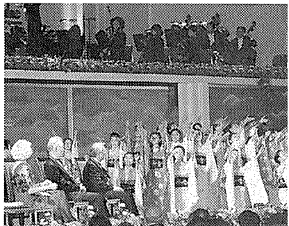
「青い地球は誰のもの」「赤とんぼ」などが