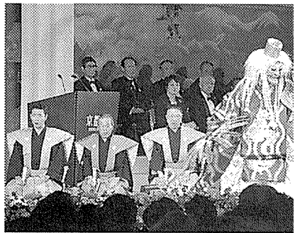
天狗の舞「鞍馬天狗」が豪放雄大!